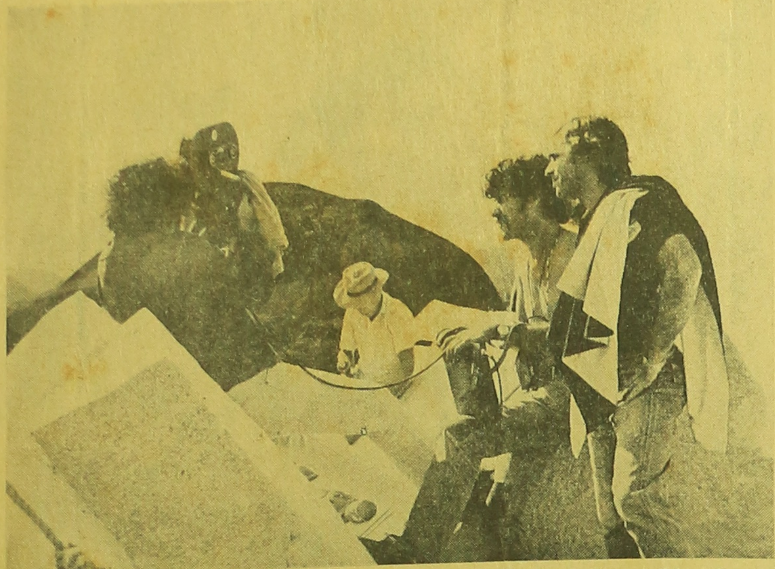
Trabalhar na Pedra, de Osvaldo Caldeira e Dileni Campos